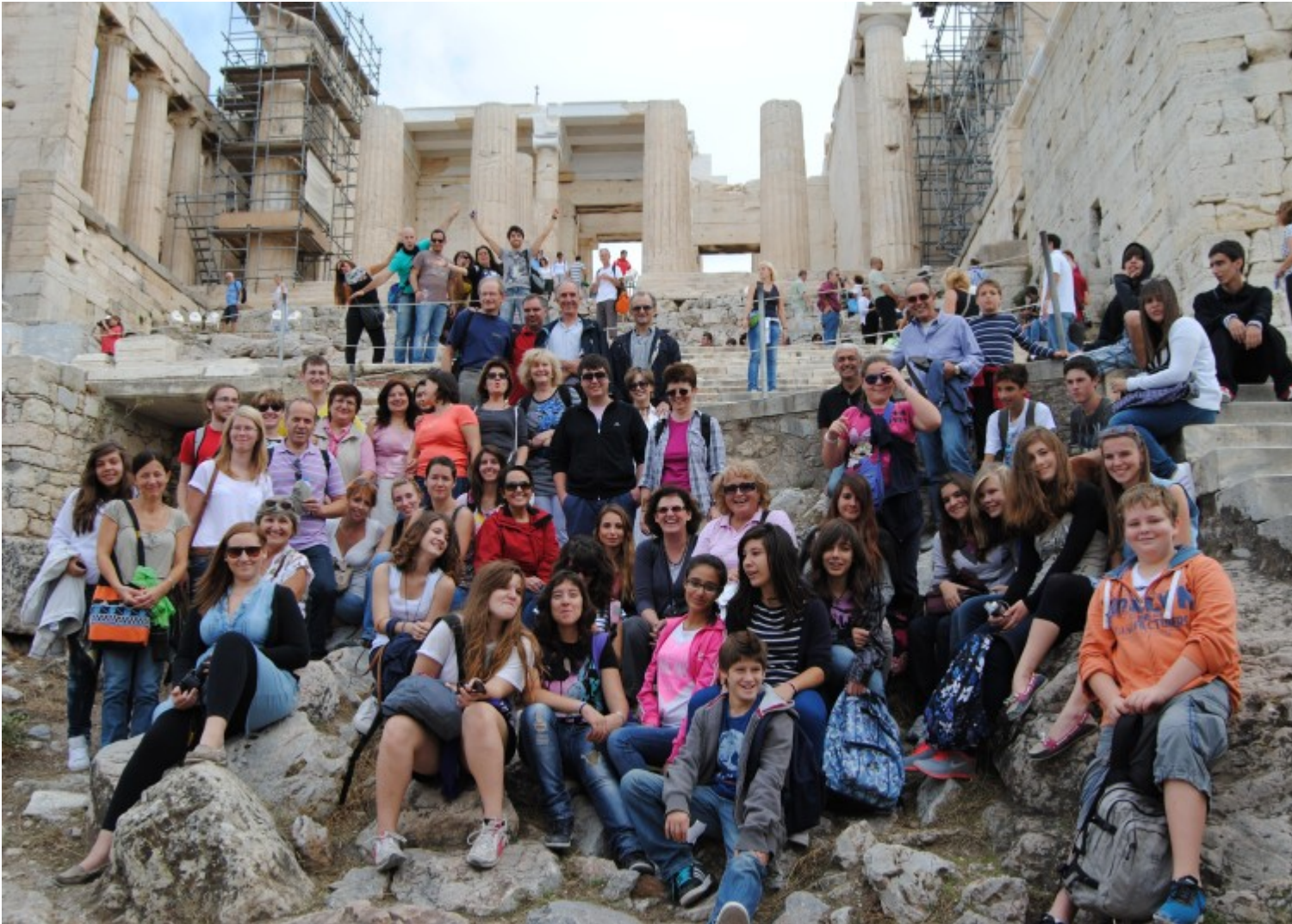
Die Comenius-Gruppe auf einem der Hügel, auf denen Europa gebaut wurde: Die Partner aus Griechenland, Litauen, der Slowakei, Ungarn und von der deutschen Hessenwaldschule waren begeistert von der Akropolis in Athen.