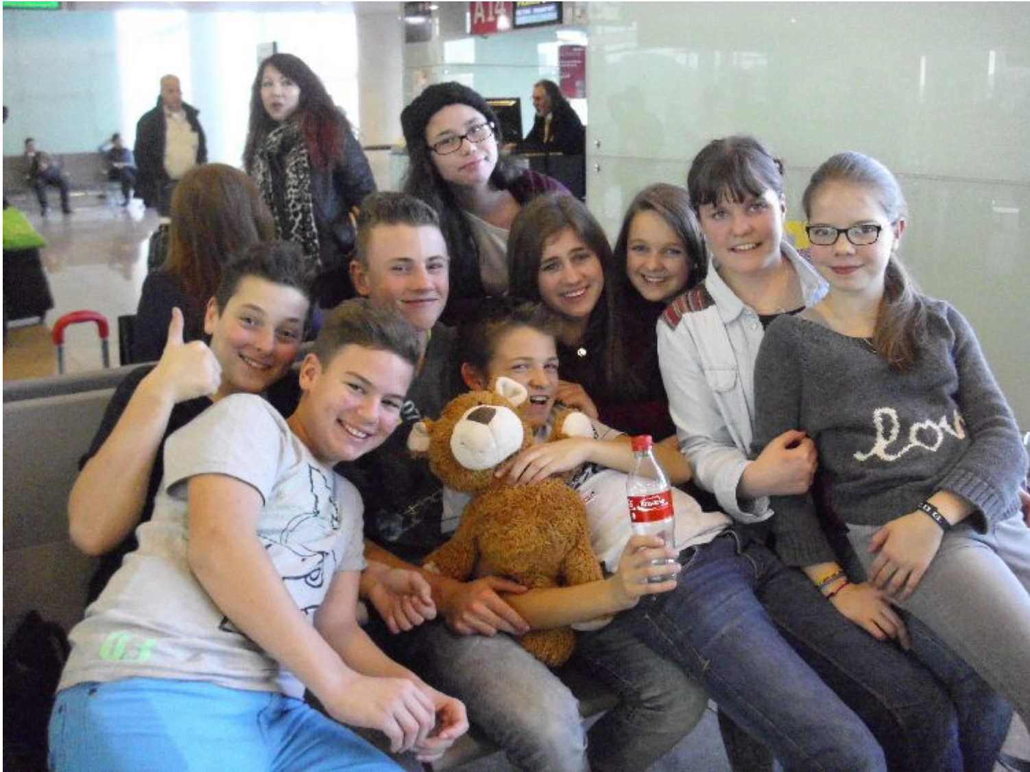
Wenig macht mehr Spaß als eine Reise und nichts bildet mehr: Die Hessenwaldschüler auf dem Weg nach Barcelona.