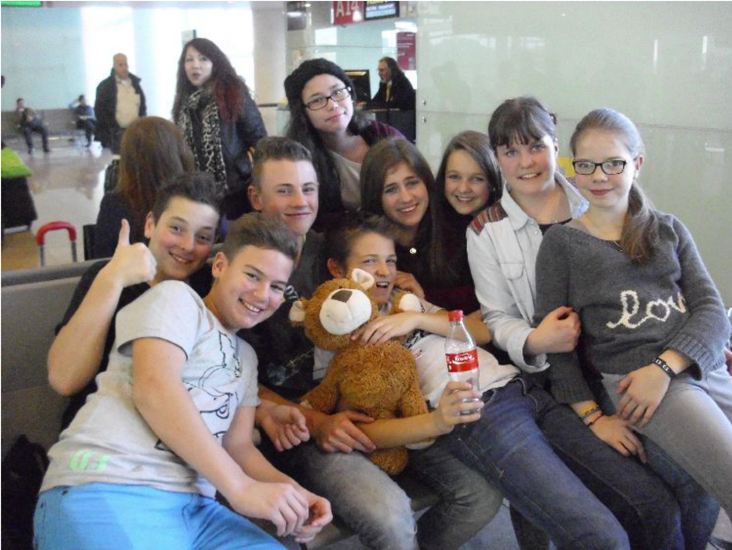
Wenig macht mehr Spaß als eine Reise und nichts bildet mehr: Die Hessenwaldschüler auf dem Weg nach Barcelona.