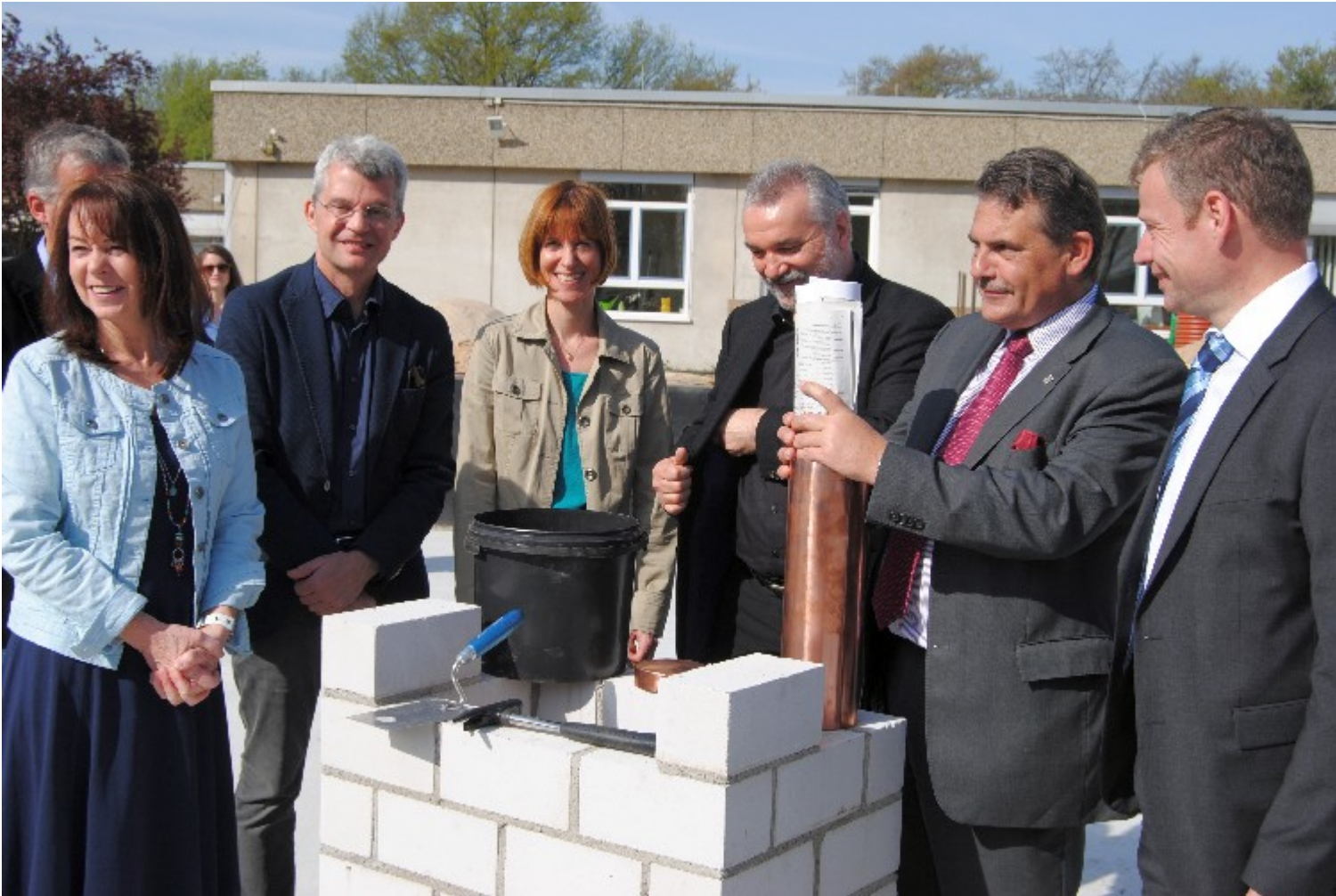
Strahlende Gesichter bei der Grundsteinlegung für die neue Hessenwaldschule.