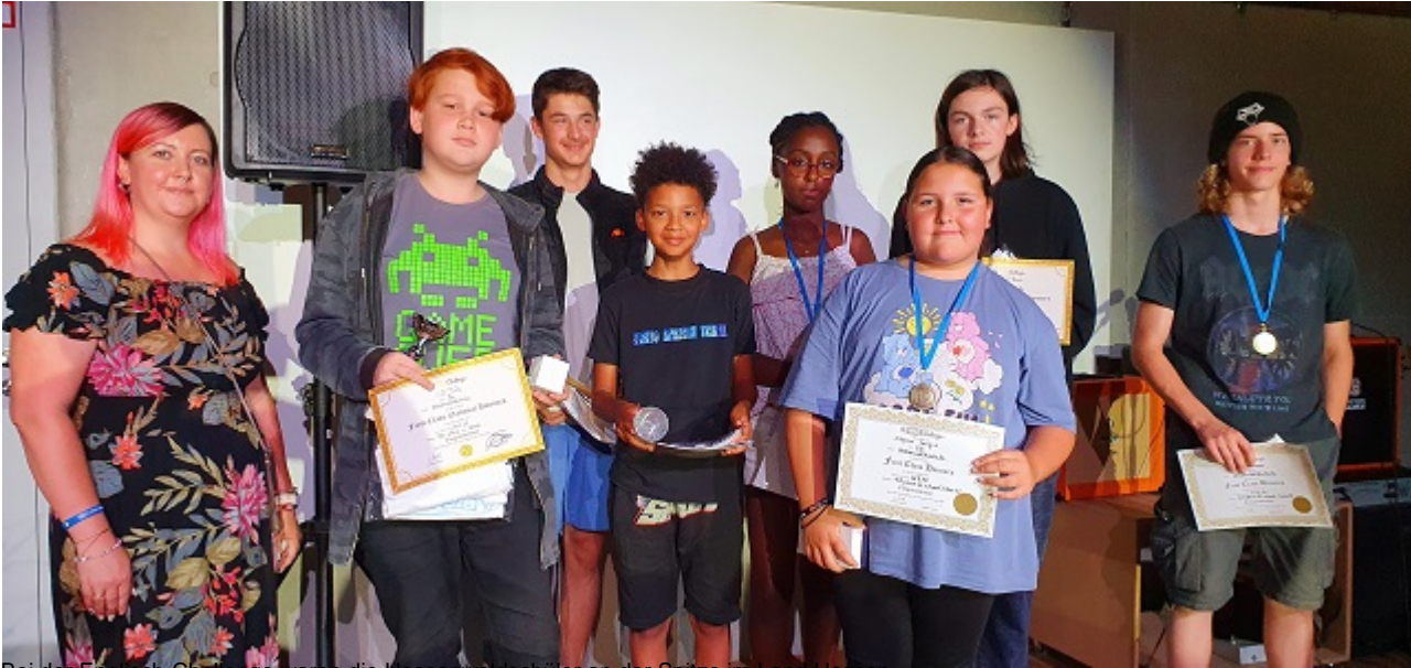
Bei der Englisch-Challenge waren die Hessenwärschüler an der Spitze im Land Hessen.

Beim Spanisch Vorlesewettbewerb waren diese Schüler*innen erfolgreich.