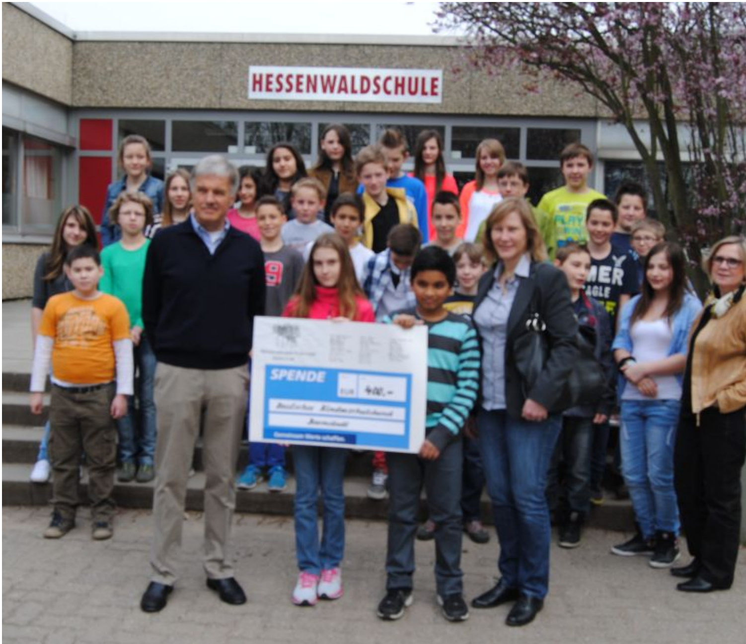
Über 400 Euro freuen sich die Vertreter des Kinderschutzbundes Darmstadt. Beilner