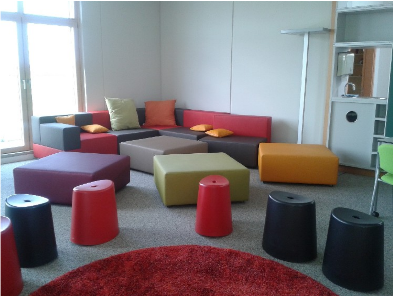
Bunt, flexibel, funktional und strapazierfähig - so unterstützen Möbel das individuelle Lernen.