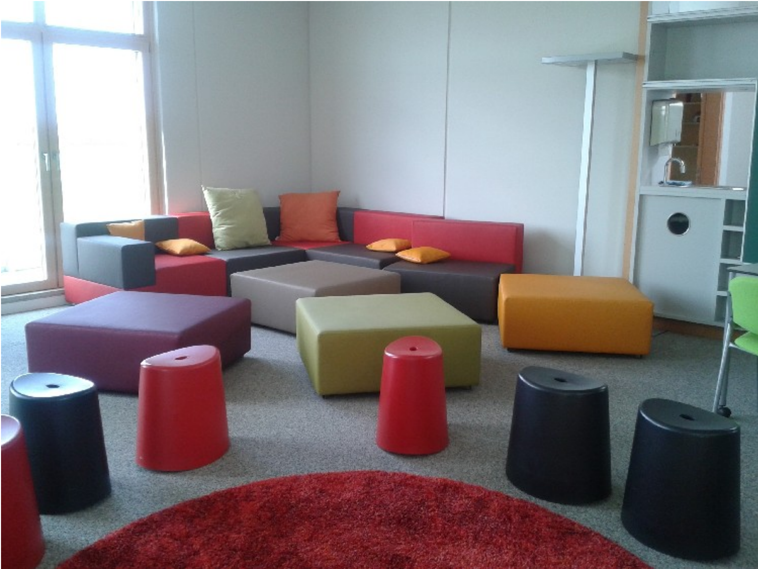
Bunt, flexibel, funktional und strapazierfähig - so unterstützen Möbel das individuelle Lernen.