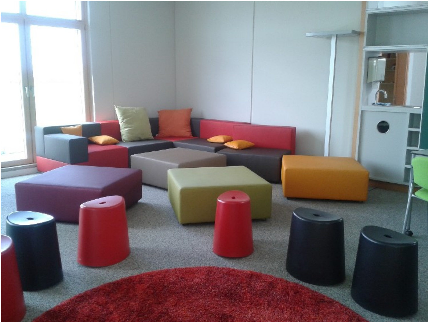
Bunt, flexibel, funktional und strapazierfähig - so unterstützen Möbel das individuelle Lernen.

Weiterstadt/Röckingen (Lör) Eine Schule, die ihre Absolventen fit für's Leben machen will, ist gut beraten, dem Leitsatz von Felix Cube von der "Lust am Lernen und Lehren" einen hohen Stellenwert einzuräumen. Dabei spielt nicht nur der schülerorientierte pädagogische Ansatz eine große Rolle, der künstlerisches Gestalten und sinnlich-ästhetisches Lernen ermöglicht. Auch die räumlichen Voraussetzungen entscheiden darüber, ob ein lebendiges, vielseitiges, und interessegeleitetes Lernen möglich ist. Wie das Kollegium der Hessenwaldschule, zielt der Ansatz der Firma LernLandSchaft genau in diese Richtung.