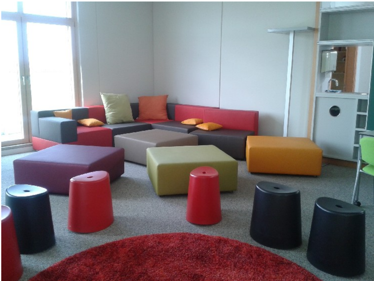
Bunt, flexibel, funktional und strapazierfähig - so unterstützen Möbel das individuelle Lernen.