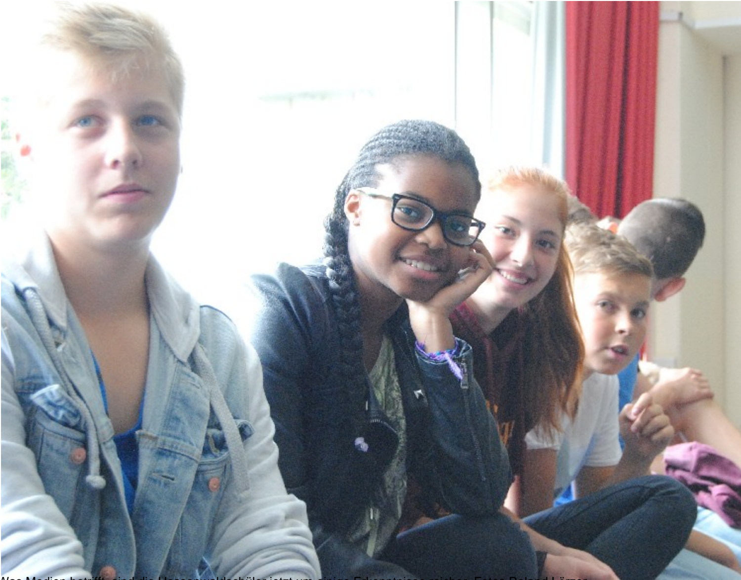
Was Medien betrifft, sind die Hessenwaldschüler jetzt um einige Erkenntnisse reicher.