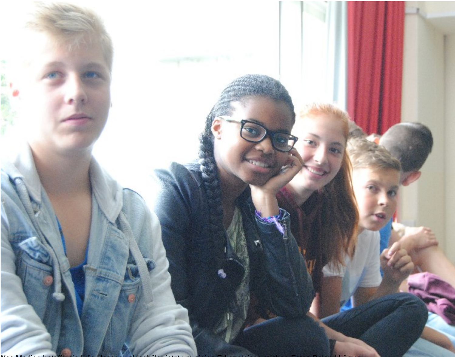
Was Medien betrifft, sind die Hessenwaldschüler jetzt um einige Erkenntnisse reicher.