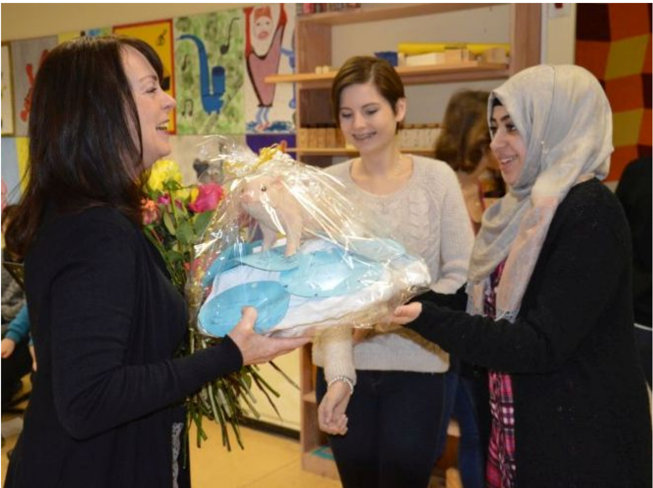
Rosen und ein Glücksschweinchen mit Flügeln - die Hessenwaldschüler verabschieden sich herzlich von

Home > News > Newsmeldung Schulreformerin mit Herz und Hand