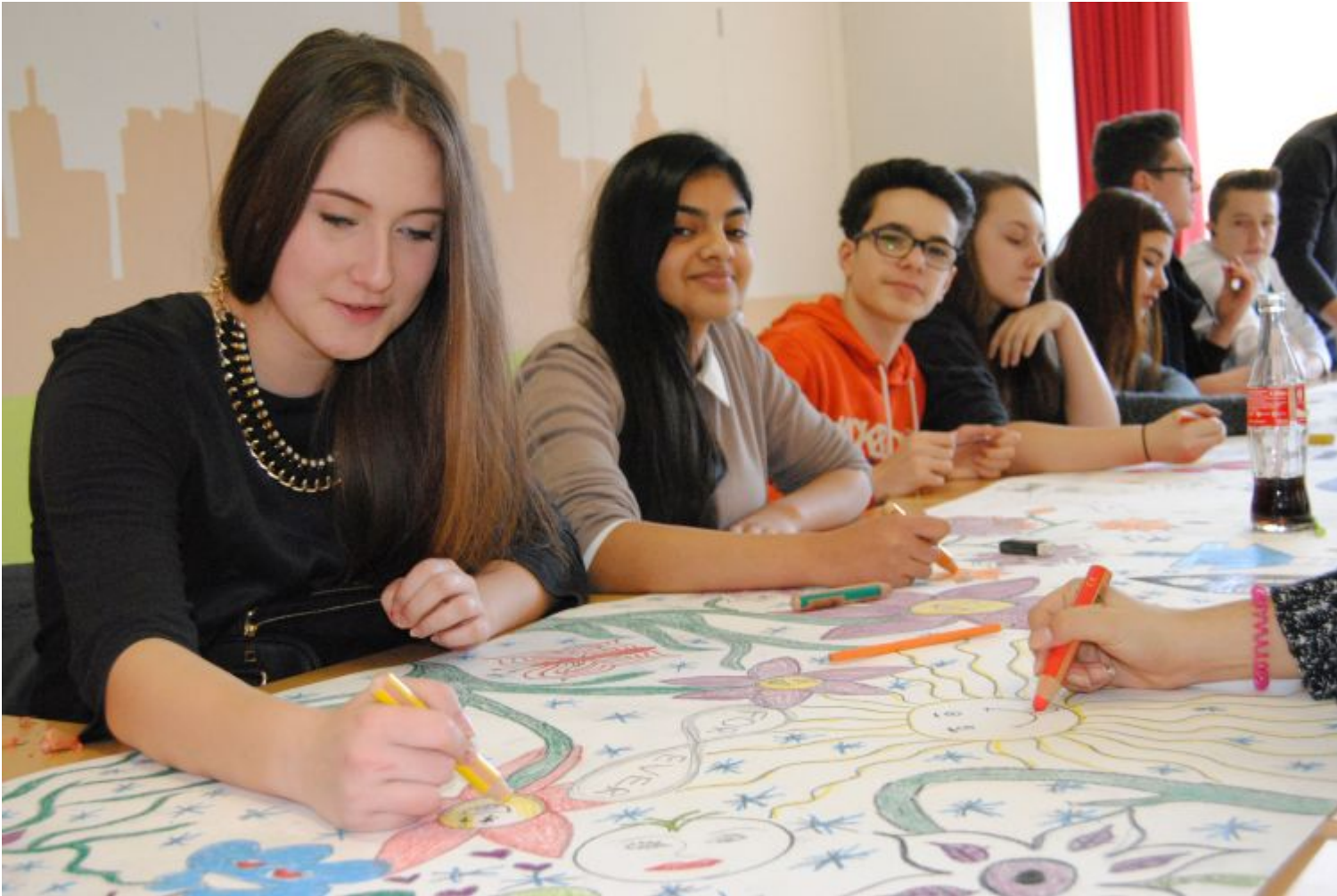
Eine bunte Welt des Lernens präsentierten Schülerinnen und Schüler am Tag des offenen Unterrichts an der Hessenwaldschule.

Weiterstadt (Lör) Zum letzten Mal ging der Tag des offenen Unterrichts im alten Gebäude der Hessenwaldschule über die Bühne. Die Arbeiten in der neuen Schule, die optimale Bedingungen bieten wird, kommen gut voran. Ende des Jahres ist der Umzug vorgesehen. Vielleicht zog es deshalb so viele Besucher in die bald historischen Räume an der Wolfsgartenallee.