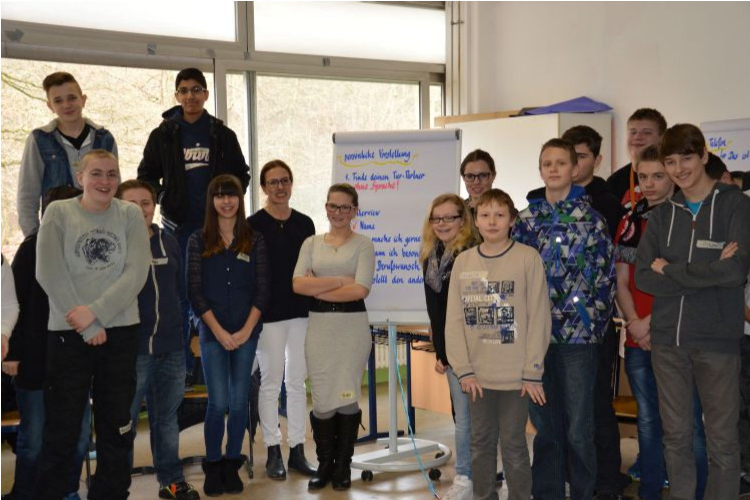
Freuen sich über den erfolgreichen Workshop - die Hessenwaldschüler der achten Klassen.

Weiterstadt (Lör) „START – Klar! Meine ersten Schritte zu einem Ausbildungsplatz“ - so hieß der Workshop für die achten Klassen. Ein kompetentes Trainer-Team von RaslanTraining aus Unterhaching begleitete die Schüler bei ihren ersten Schritten der Berufsorientierung.