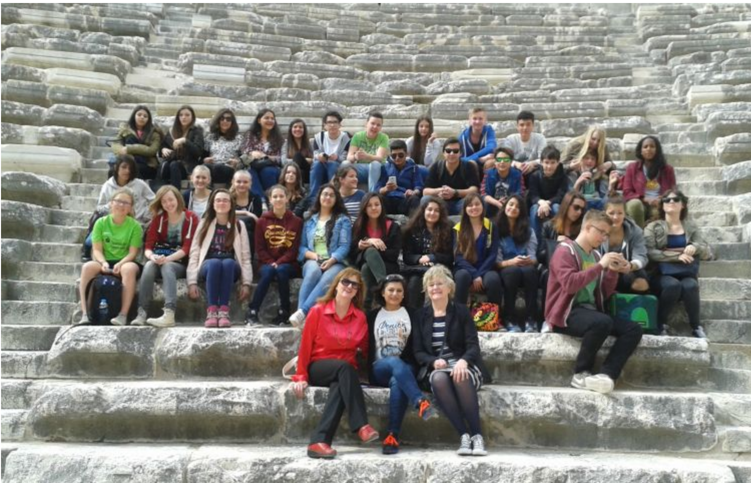
Die Austauschschülerinnen mit ihren Betreuerinnen.

Home > News > Newsmeldung Aspendos, Basar und Chai