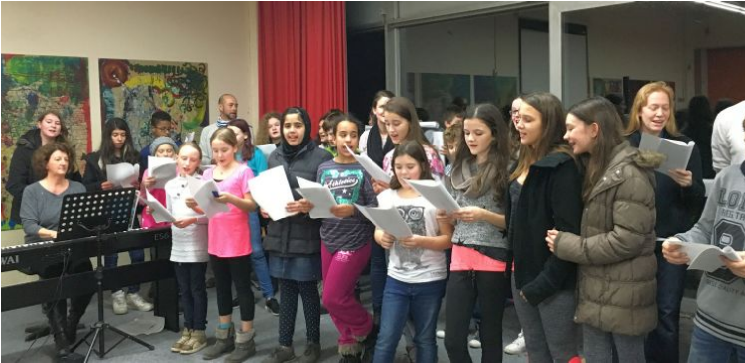
Großer Chor bei der Weihnachtsfeier mit Lehrern und Schülern.