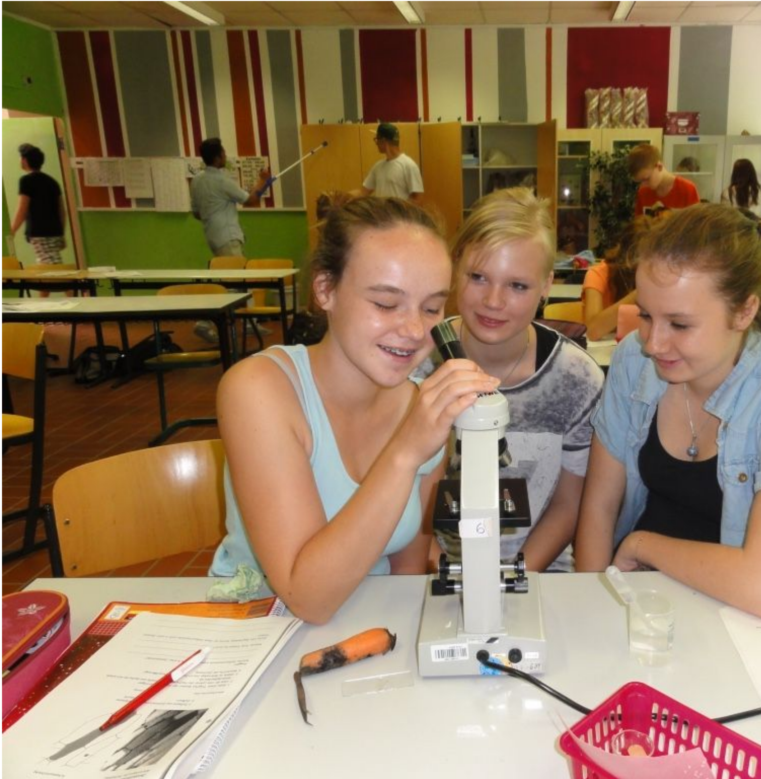
Mikroskopisches Praktikum Klasse 9