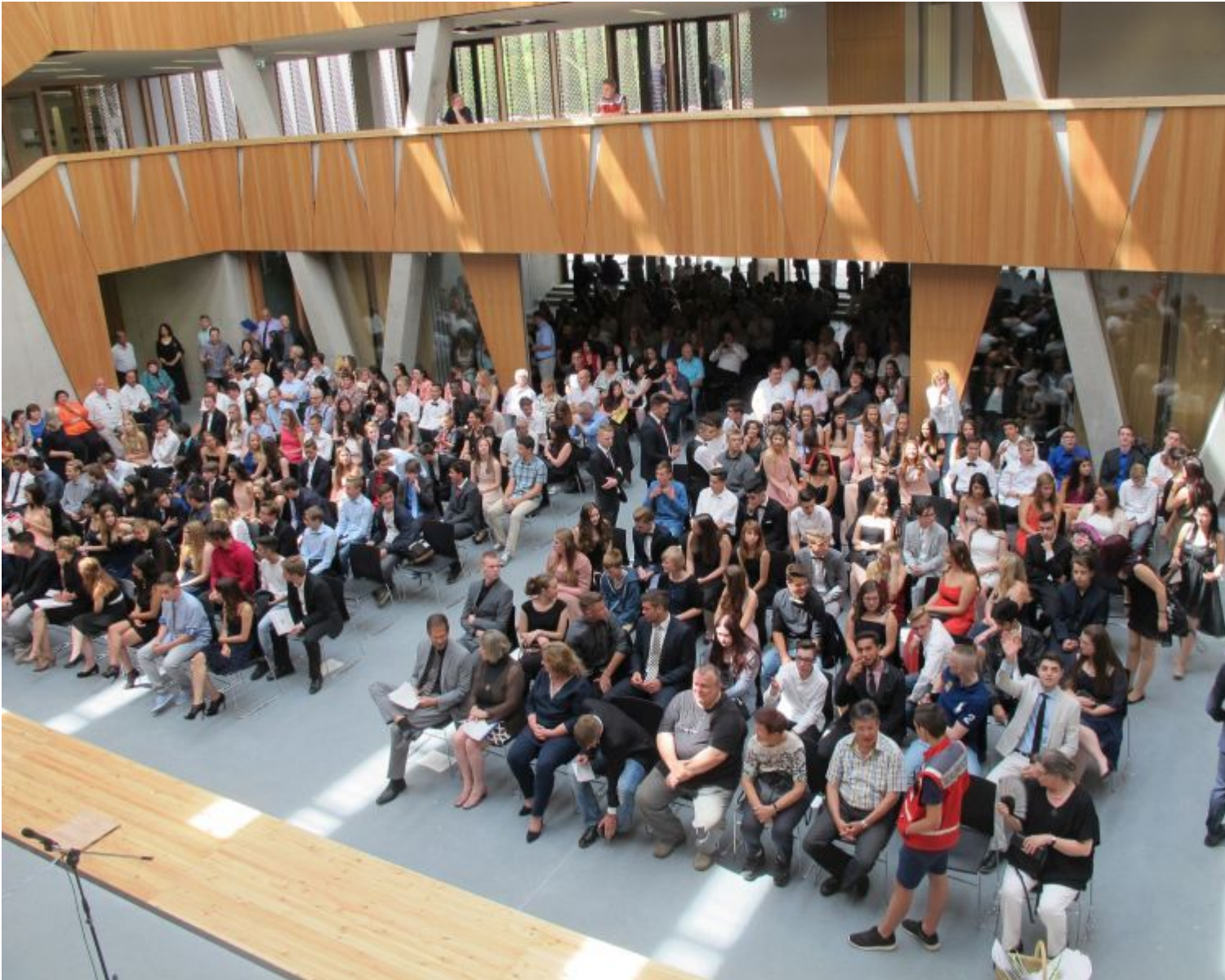
Blick in die Aula der neuen Hessenwaldschule während der Abschlussfeier 2016.

Weiterstadt (Lör) Sie haben miterlebt, wie das neue Gebäude immer mehr Gestalt annahm. Aber sie verlassen die Hessenwaldschule wenige Wochen vor dem Umzug in die hochmodernen Räume. Da wollten die Neunt- und Zehntklässler wenigstens ihre Abschlussfeier in der neuen Schule erleben. Die luftige und lichtdurchflutete Aula bietet geradezu ideale Voraussetzungen. So wurde der letzte Jahrgang der alten Schule in der neuen verabschiedet. Auf der Bühne war während der ganzen Feier ein Bild der Schülerin präsent, die am Tag vor der Feier den Tod gefunden hatte.