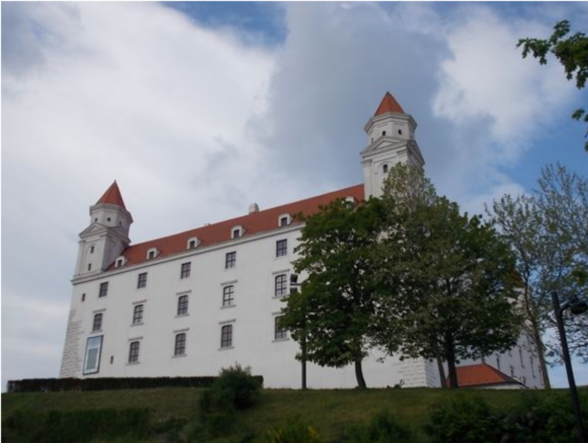
Die Burg über der Stadt - das Wahrzeichen Bratislavas.