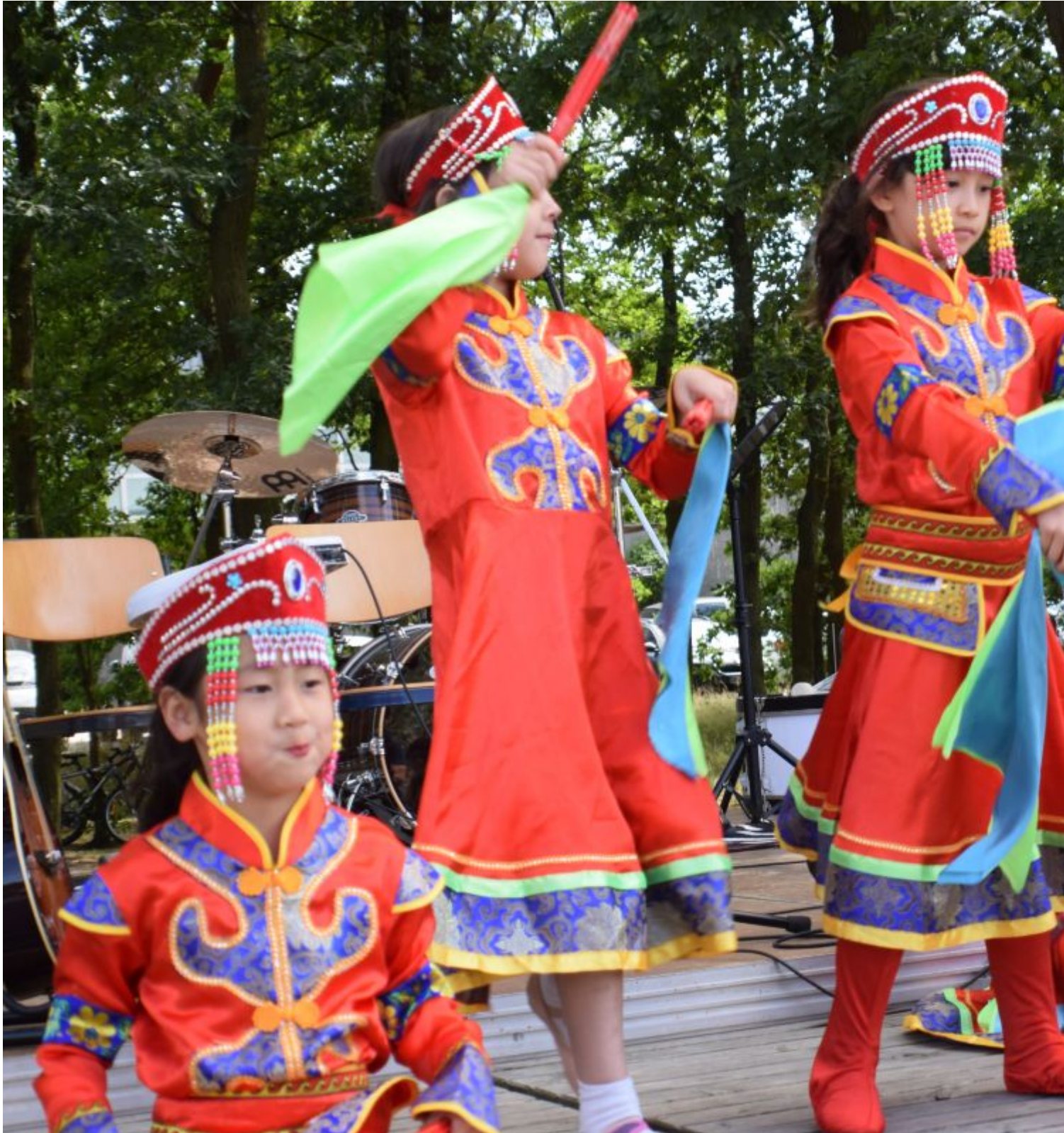
Buntes Farbenspiel, farbieter Tanz - Schülerinnen der Huada-Schule begeistern das Publikum