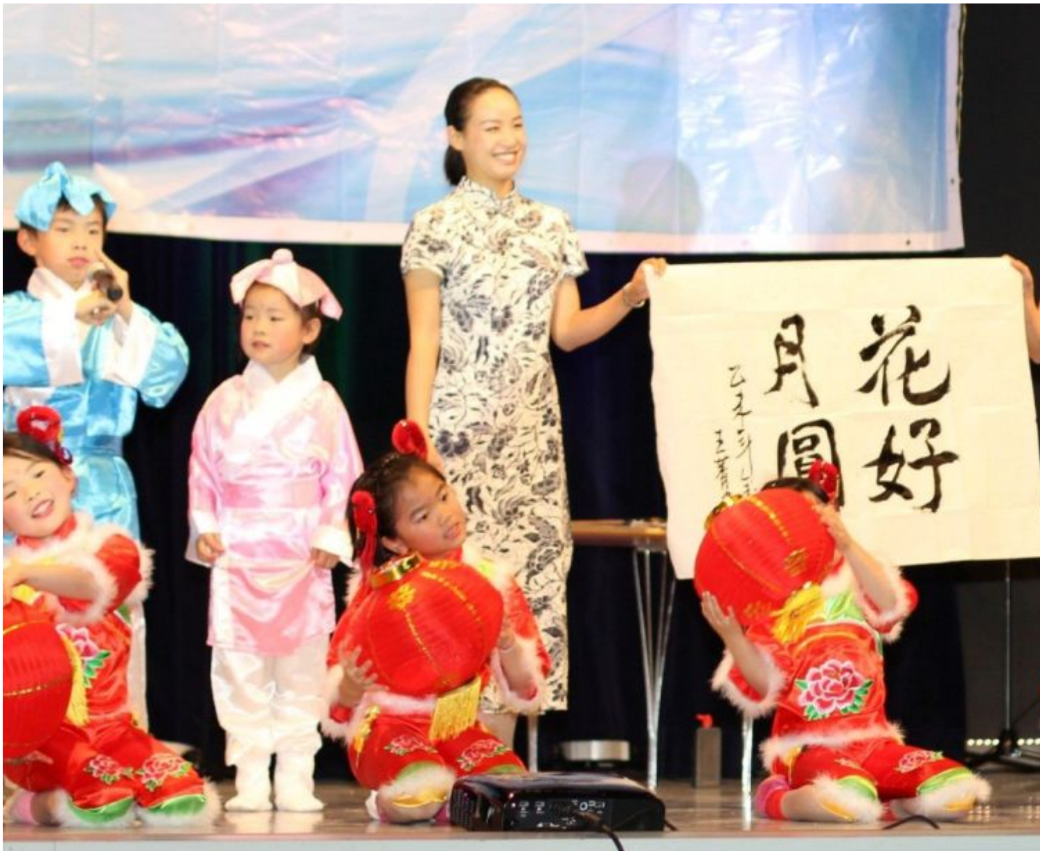
Am Ende des Herbstcamps steht eine große Aufführung.

Weiterstadt (Lör) Auch wer in den Herbstferien nicht verreist, hat an der Hessenwaldschule die Möglichkeit, eine großartige Kultur kennenzulernen: Zum zweiten Mal bietet die Huada-Schule ein Herbstcamp an. Vom 7. bis zum 14. Oktober tanzen, singen, malen, schneiden, spielen und kämpfen angemeldete Kinder und Jugendliche vor und in der Hessenwaldschule. Denn dort läuft nicht nur das Herbstcamp, hier ist die Huada-Schule auch beheimatet.