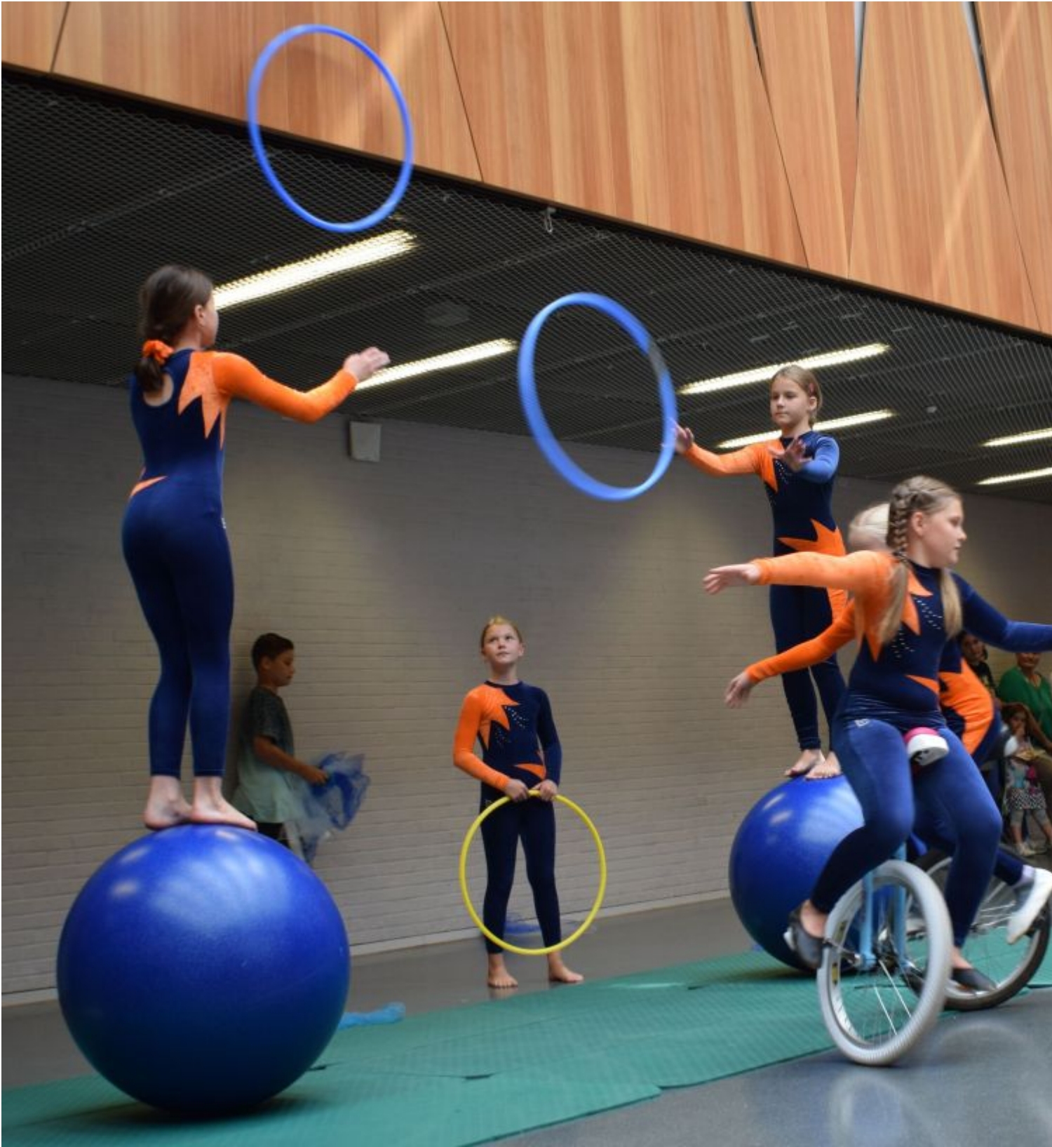
Ein akrobatisches Feuerwerk zündeten die Schülerinnen und Schüler von Katja Baader, der Leiterin der Zirkus AG.

Weiterstadt Einen besonderen Tag erlebten die neuen Hessenwaldschüler am ersten Schultag - und das