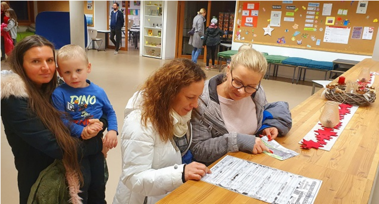
Jahgangsbereich: Was können wir noch erleben? Besucherinnen orientieren sich in einem Jahgangsbereich.