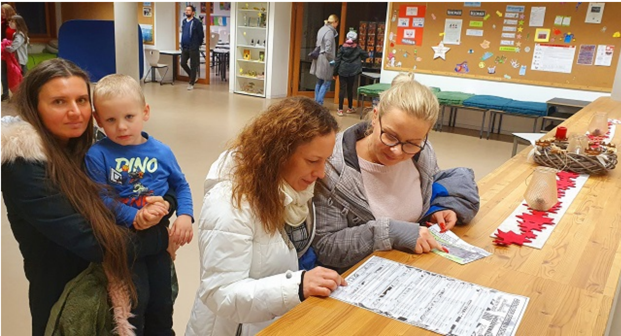
Jahgangsbereich: Was können wir noch erleben? Besucherinnen orientieren sich in einem Jahgangsbereich.