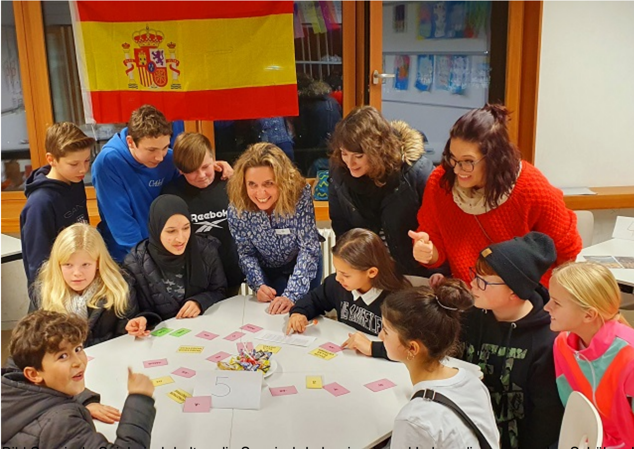
Bild Spanisch: Spielerisch holten die Spanisch-Lehrerinnen und Lehrer die angenehmen Schüler ab.

Weiterstadt (Lör) Das Interesse an der Hessenwaldschule ist groß: Am Abend der offenen Schule pilgerten Eltern, Kinder und viele Ehemalige in Scharen in die moderne Ganztags- und Kulturschule. Schulleiter Markus Bürger konnte aus dem Vollen schöpfen: Die Pädagogik zielt auf die Begabungen der einzelnen Kinder und dass er eine der bestausgestatteten Schulen des Landkreises für digitale Medien leitet, spricht für sich.