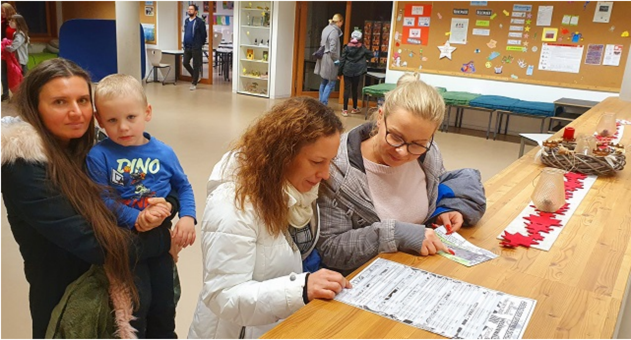
Jahgangsbereich: Was können wir noch erleben? Besucherinnen orientieren sich in einem Jahgangsbereich.