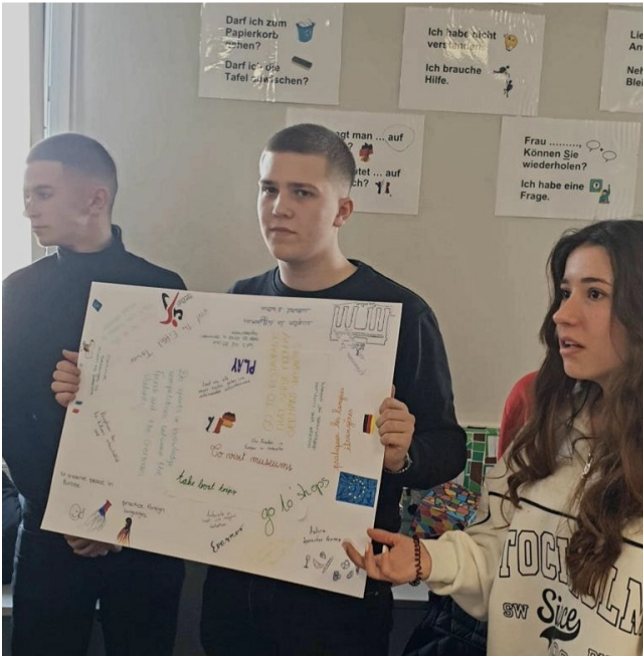
Präsentation der Ergebnisse: Jugendliche wünschen sich mehr Mitspracherechte.

Auf den Stufen zu La Defense, dem modernen Paris, das in der Mitterrand-Ära entstand.