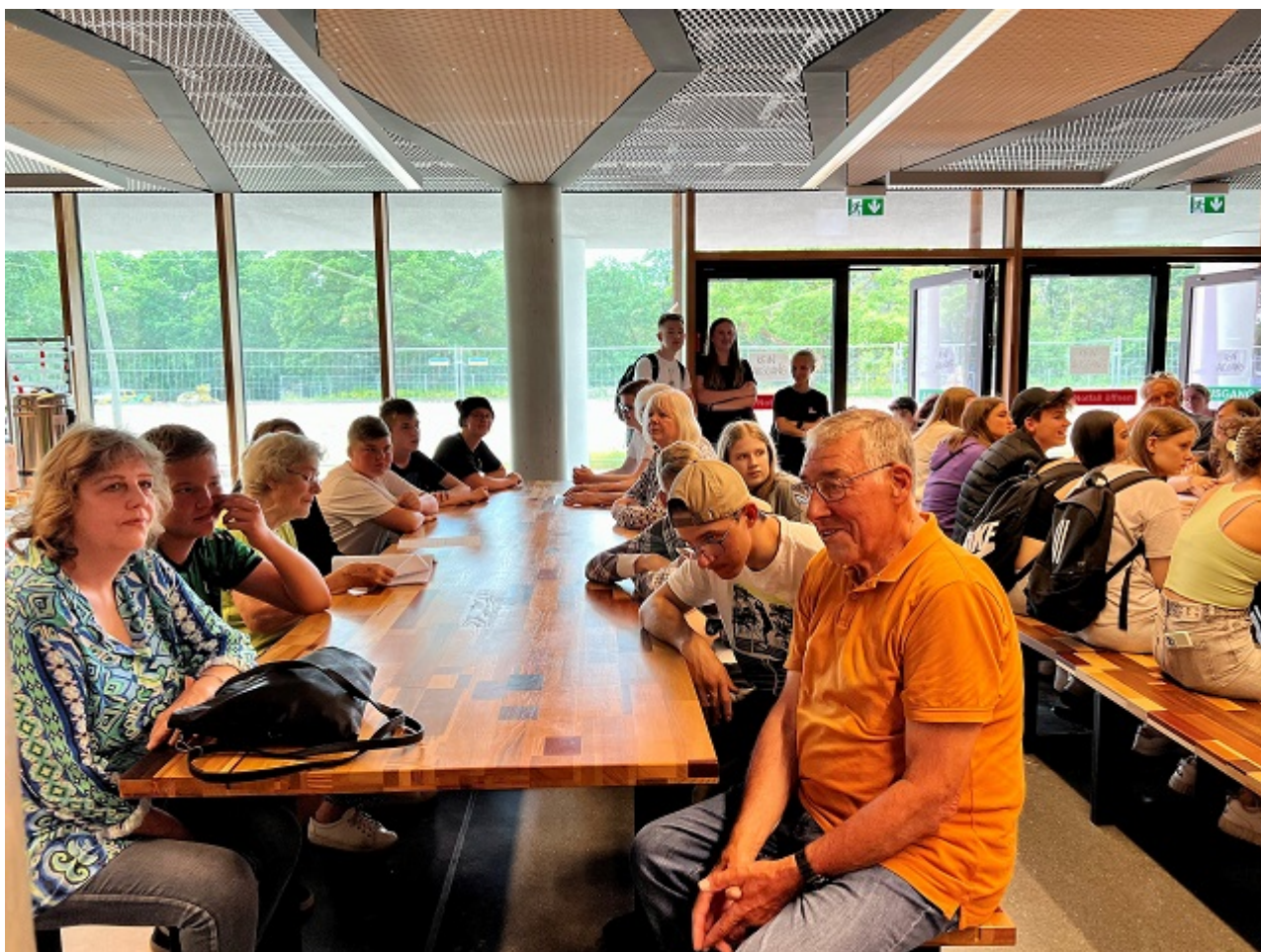
Zeit-Schenken – alles andere als verschenkte Zeit. Ein Projekt an der HWS.

Nach zehn Wochen endete das diesjährige „Projekt Zeit-Schenken“ des 9. Jahrgangs im Rahmen des Religions- und Ethikunterrichts. Ziel des Projektes ist die Verbindung der SchülerInnen mit der Generation des gehobenen Alters.