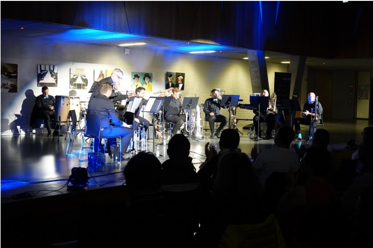
Weisterstadt (Bür) Das Weiterstädter Blechbläserensemble „Brassbande“ gastierte am Samstagabend (7.10.23)