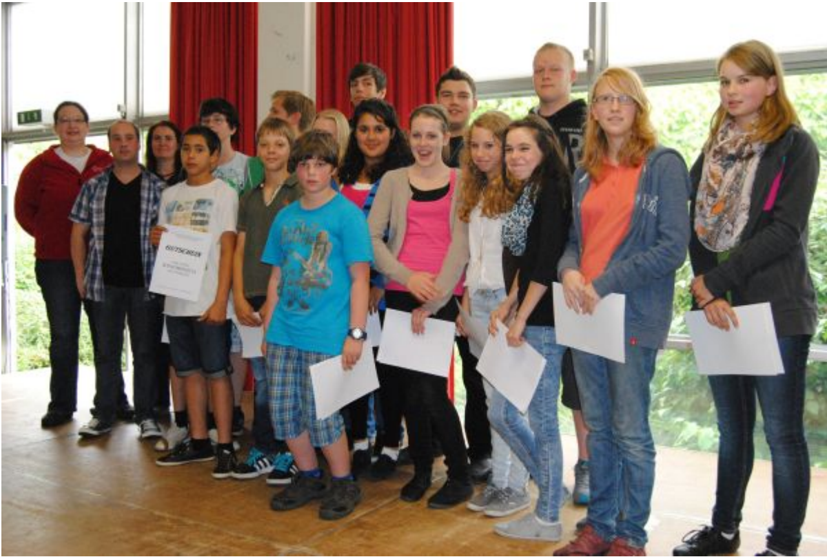
Helfer in der Not - die Schulsanitäter der Hessenwaldschule.